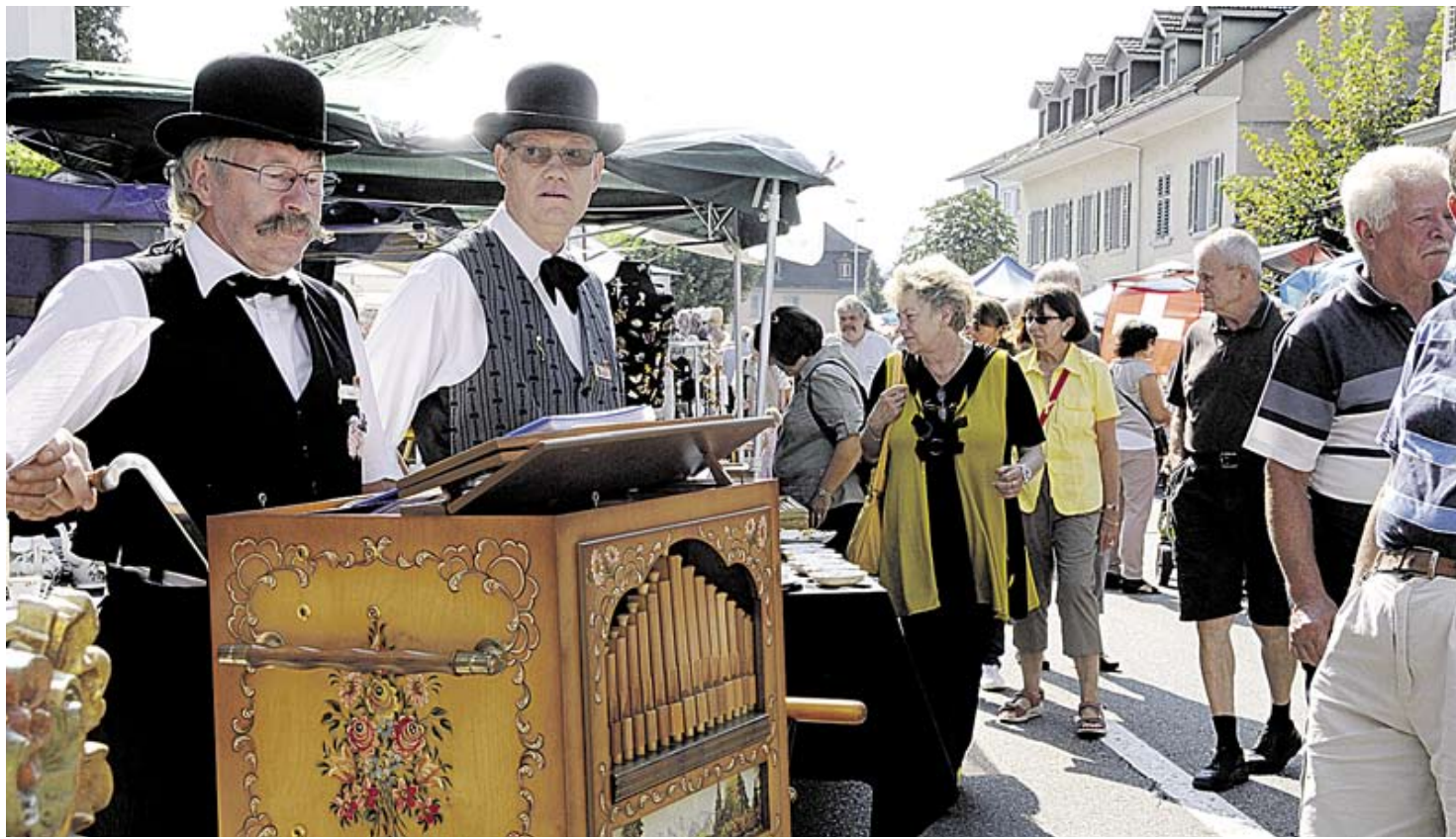
Drehorgelmusik und Gesangsdarbietung vor dem «Schwert» in der mit vielen Besuchern gesäumten Schwertgasse.